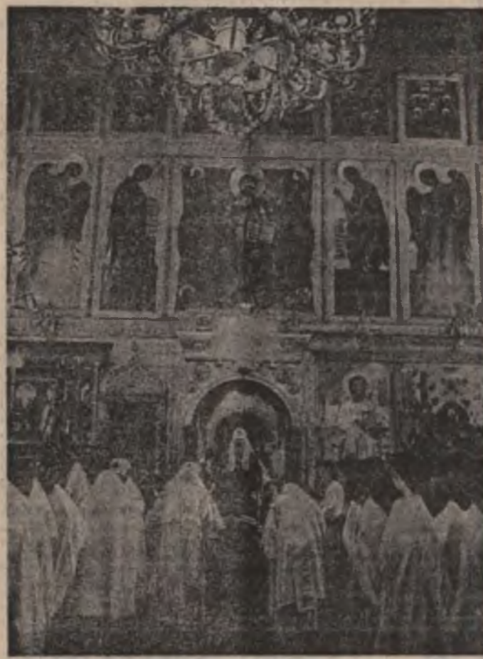
Утром 26 августа перед началом сессии Верховного Совета СССР в Успенском соборе Кремля состоялась торжественная панихида по убиенным, которую отслужил Патриарх Московский и Всея Руси Алексий II. На панихиде присутствовали Президент России, народные депутаты СССР и РСФСР.